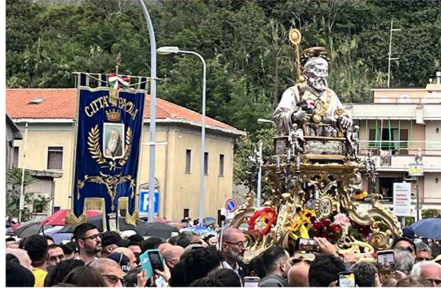
FESTA PATRONALE SAN FRANCESCO DI PAOLA

SETTORE 2 TECNICO - MANUTENTIVO - URBANISTICA - SUAP RESPONSABILE ARCH. ALESSANDRA DI BENEDETTO