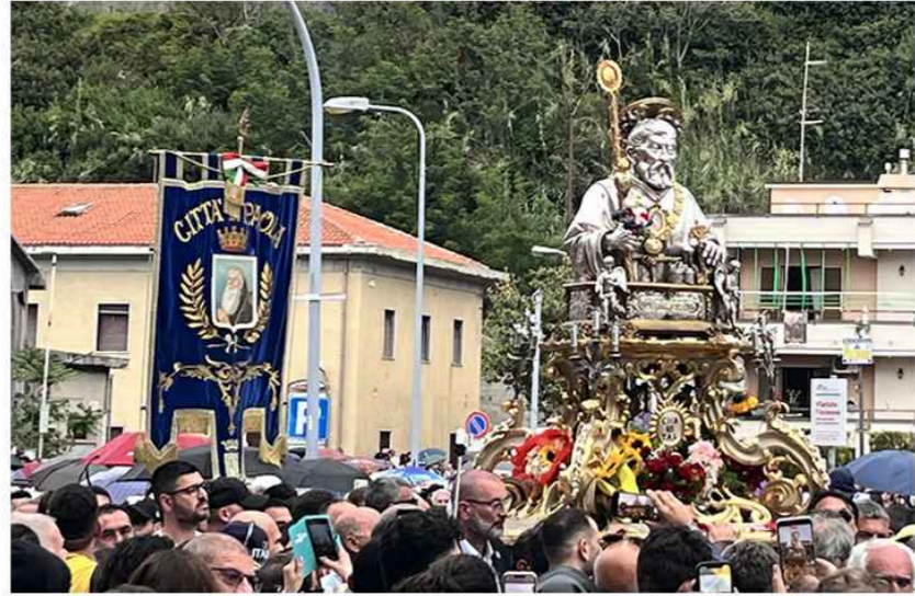
FESTA PATRONALE SAN FRANCESCO DI PAOLA

SETTORE 2 TECNICO - MANUTENTIVO - URBANISTICA - SUAP RESPONSABILE ARCH. ALESSANDRA DI BENEDETTO