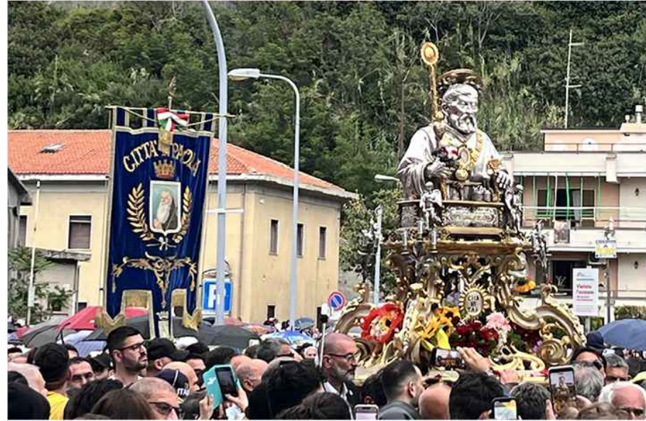
FESTA PATRONALE SAN FRANCESCO DI PAOLA

SETTORE 2 TECNICO - MANUTENTIVO - URBANISTICA - SUAP RESPONSABILE ARCH. ALESSANDRA DI BENEDETTO