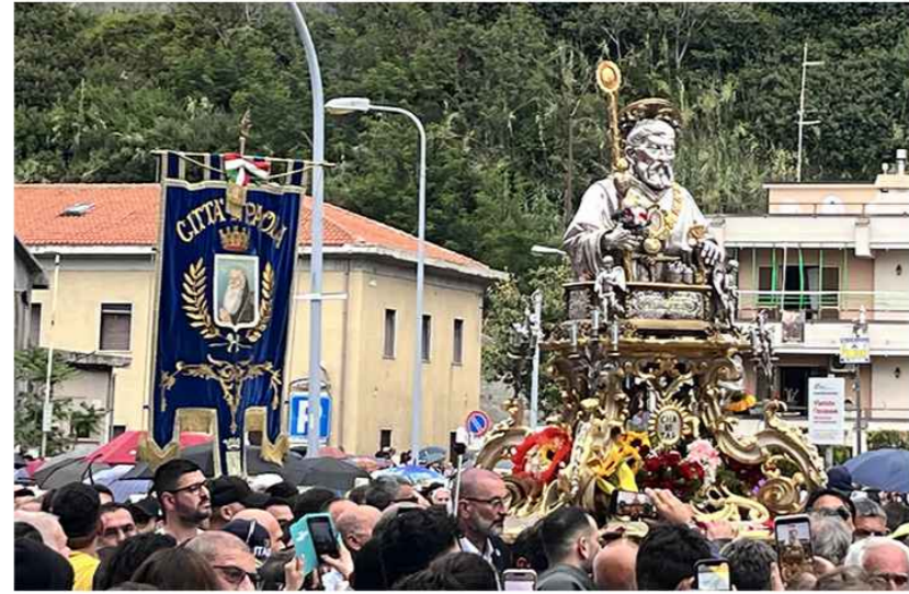
FESTA PATRONALE SAN FRANCESCO DI PAOLA

SETTORE 2 TECNICO - MANUTENTIVO - URBANISTICA - SUAP